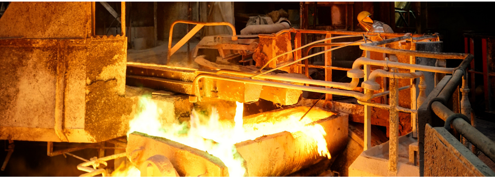
Metal Refining & Processing